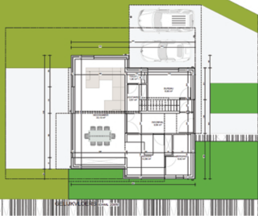
GELUKVLOERS SCHAAL 1/2000